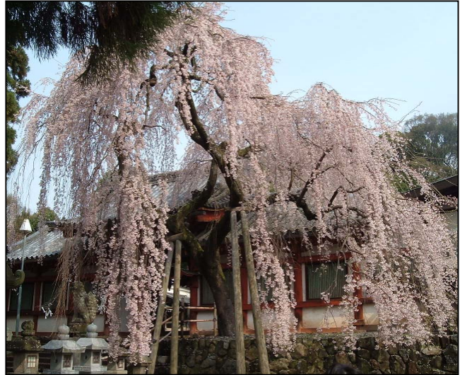
Nara – 3 Aprile 2007

La società giapponese ancora oggi è permeata di grande ammirazione per la natura. Per chi come me è spesso in Giappone, e principalmente in primavera, è facile capire l'ammirazione di questo popolo per la fioritura del Sakura (ciliegio giapponese). Attraversare il Giappone nel periodo della fioritura del sakura è un'esperienza indimenticabile anche per la sensibilità interiore e i flussi di pensiero che pervadono la nostra mente davanti a tale spettacolo della natura.