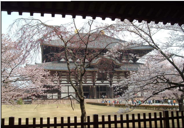
Nara – 3 Aprile 2007

Il popolo giapponese riconosce nel sakura la raffigurazione della vita perfetta: bella, come il sakura, folgorante, come la fioritura, e che va via come il fiore, ancora splendente, che si stacca dal ramo e vola via nel vento.